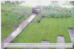
La croix centrale est noire, recouverte de zinc sur les bords extérieurs, sauf le centre où est insérée une bande de cuivre apportant un bon chaud renvoyant vers la spiritualité.