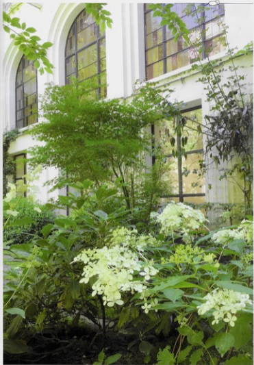
Page de gauche : le Soleinla soleinli permet une jointure naturelle entre les dalles de schiste, tandis que des Hydrangées (jo-cotte) , représentant les quatre évangélistes, sont plantés dans chaque coin du cloître